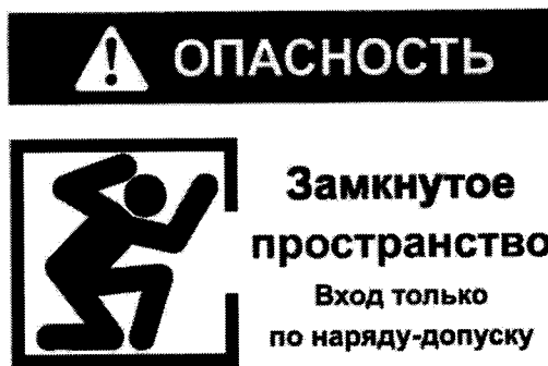
Рекомендуемый знак «ОЗП».

2. Объекты, вошедшие в Перечень 1 и не являющиеся территориально обособленными объектами, должны быть обозначены знаком «ОЗП» (рекомендуемый текст).